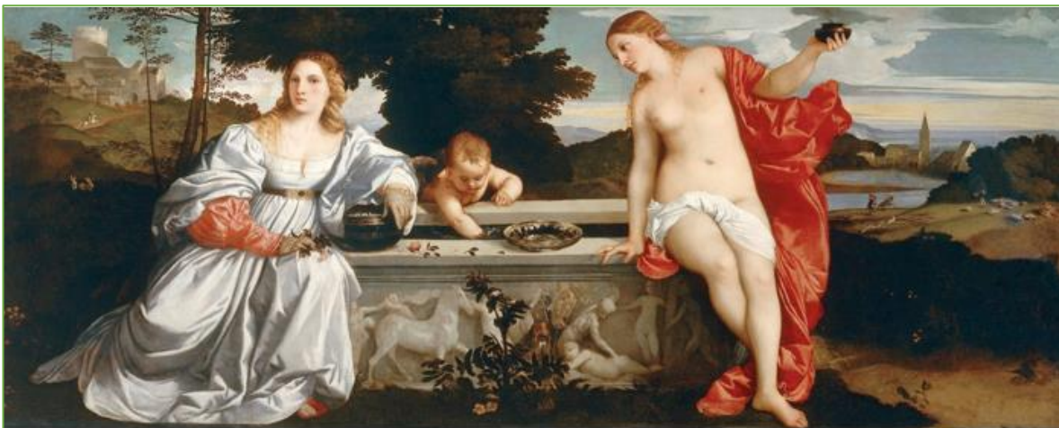
Sacred and Profane Love, Tiziano, 1515, Galería Borghese

Afrodita Ourania (Celestial de Libra), por venir de la castración de Urano, hija del cielo. que preside la más alta forma de amor – el amor más elevado y el amor por lo más elevado: “lo celestial”. Esta Afrodita es la que pone el orden en el Cosmos.