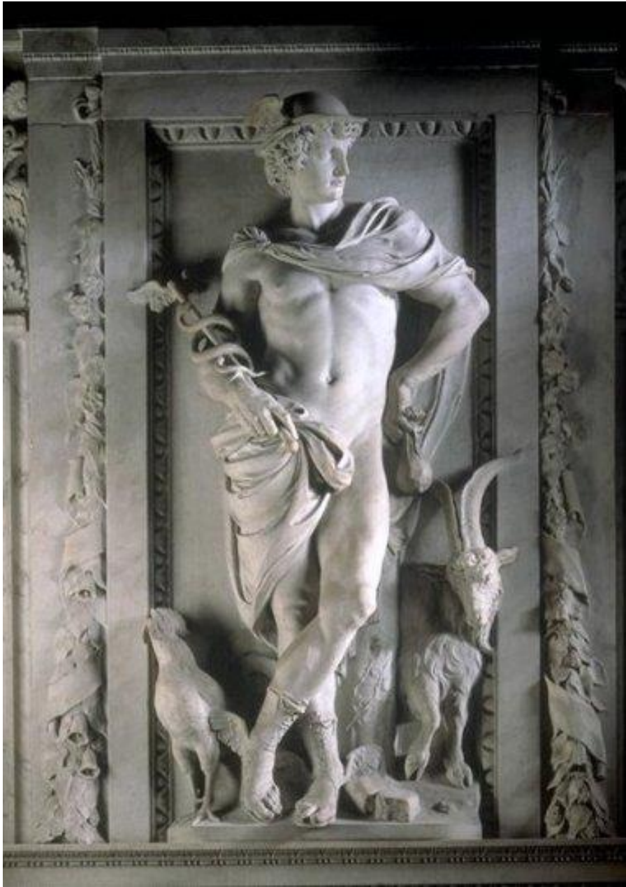
FILE. AMSTERDAM KONINKLIJK PALEIS, ARTUS QUELLINUS I's, MERCUR

Para muchos de ustedes el término de: ¡Cuidado, Mercurio está retrógrado! Es algo ya muy sonado, pero ¿qué es lo que significa realmente tanto mitológica, psicológica como astronómicamente?